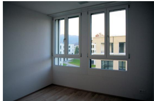
Elternschlafzimmer mit Parkett