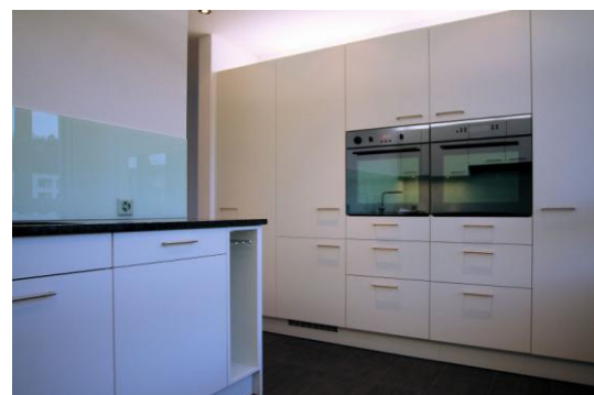
mit viel Stauraum