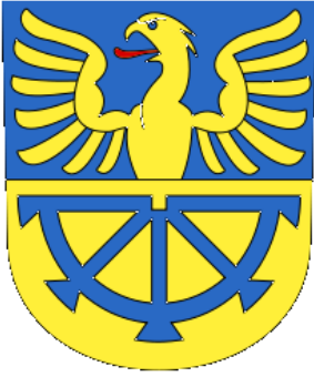
Wappen von Adliswil